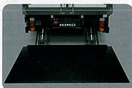
升降尾門(單缸/雙缸)